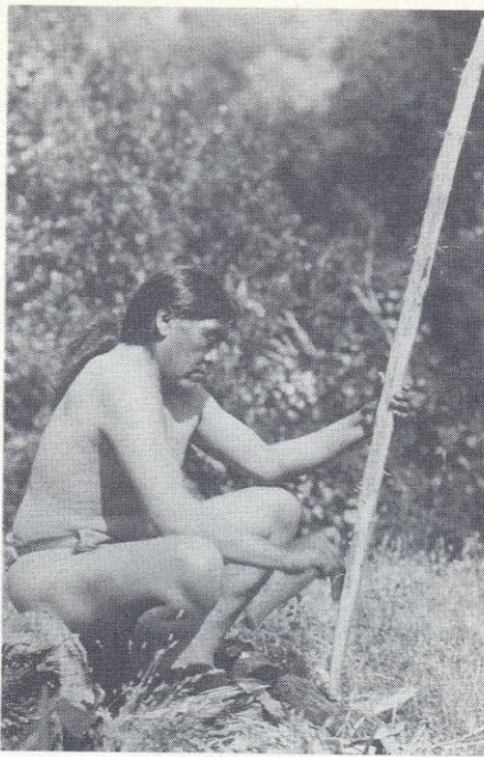
Ishi, l'indiano che abbandonò la vita primitiva nelle regioni selvagge della California uscendo allo scoperto nel 1911, mentre lavora un pezzo di ginepro con un'ascia (1914 circa).