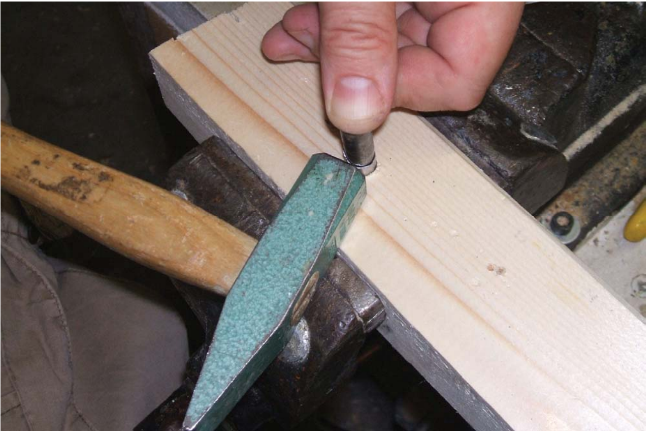
La punta finita

Arrotondare la base del cono, se necessario, battendola leggermente con il martello su un'altra punta usata come forma.